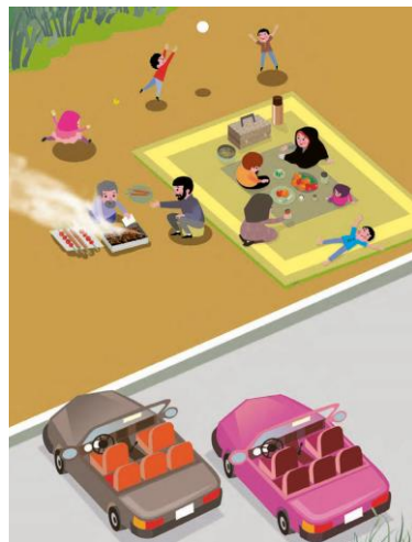
تصویر ۴. ریاضی پایه اول - ص ۲۹

در تصویر، هیچ فردی مستقیماً به دوربین نگاه نمی‌کند که این امر حس طبیعی بودن صحنه و مشاهده یک موقعیت واقعی و روزمره را به بیننده القا می‌کند. فاصله نزدیک افراد خانواده از یکدیگر نشانه‌ای از صمیمیت و انسجام خانوادگی است، در حالی که فاصله ماشین‌ها از فضای خانواده، دوگانگی میان دنیای صنعتی و زندگی خانوادگی را نشان می‌دهد. زاویه دید بالا (High Angle) تمامی اجزا را به وضوح نمایش می‌دهد و دیدی بی‌طرفانه و کل‌نگرانه به تصویر می‌بخشد. هم‌چنین، فاصله دوربین از خانواده حس مشاهده‌ای آرام و غیرمداخله‌گرانه ایجاد کرده است.