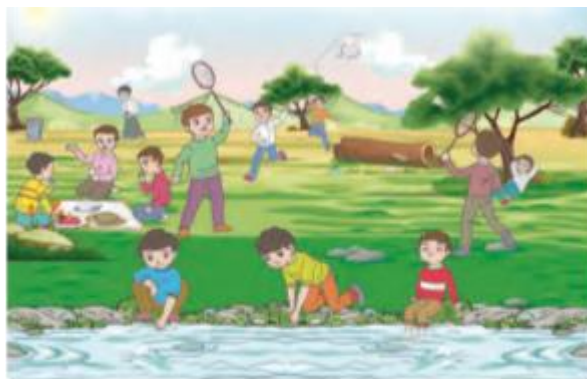
تصویر ۶. هدیه‌های آسمانی پایه سوم - ص ۱۲