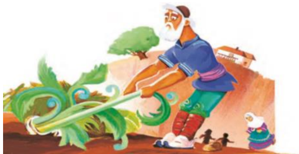
تصویر ۱. فارسی پایه دوم-ص ۱۳

۱. معنای بازنمودی (الگوی بصری، چیدمان-اشیا- اجزای همراه)