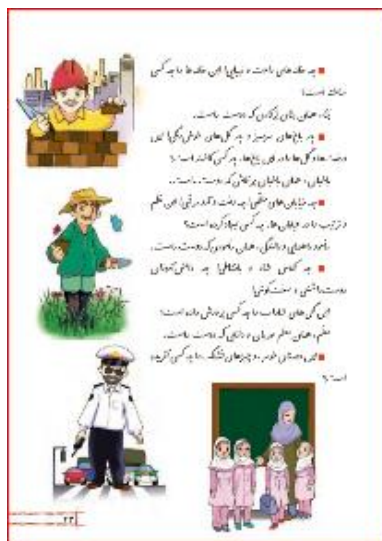
تصویر ۷. فارسی پایه دوم - ص ۴۸