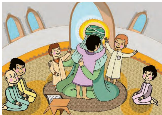
تصویر ۵. قرآن پایه اول - ص ۶۷