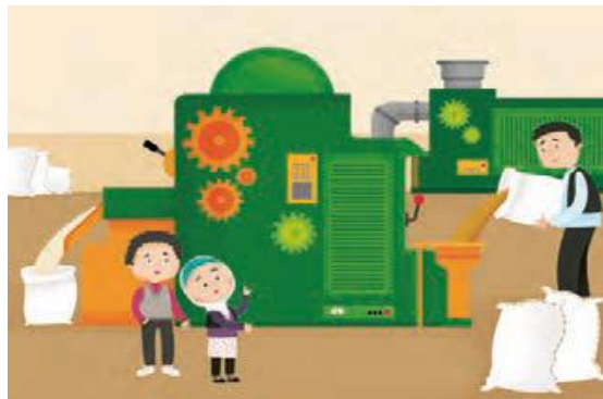
تصویر ۳. علوم اجتماعی پایه سوم- ص ۴۱

محدودیت نقش‌های اجتماعی دختران: حذف دختران از تصویر، فعالیت‌های کاوشگرانه را مختص پسران نشان می‌دهد و الگوهای ذهنی محدودکننده‌ای برای دختران ایجاد می‌کند. تثبیت کلیشه‌های جنسیتی: تصویر، فعالیت‌های بیرونی را به پسران و کارهای آرام را به دختران نسبت می‌دهد، که می‌تواند فرصت‌های برابر را از دختران سلب کند. تضعیف همبستگی جنسیتی: نمایش تعامل دختران و پسران در فعالیت‌های علمی می‌توانست برابری و همکاری جنسیتی را تقویت کند.