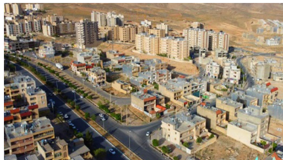
تصویر ۱. عدم پیوستگی ساختمان‌ها و ایجاد نکردن فضای تعریف‌شده در برخی مناطق شهر و وجود فضاهای خالی بسیار در سطح شهر